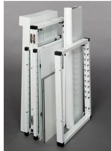
G-Flexx Bar; Breite 1,2 m

Wird eine Bar überwiegend in der gleichen Größe, Ausstattung oder dem gleichen Standort eingesetzt und wird die Bar überwiegend nur innerhalb einer Location bewegt, so ist dies mit G-Raxx kostengünstiger umzusetzen als mit G-Flexx.