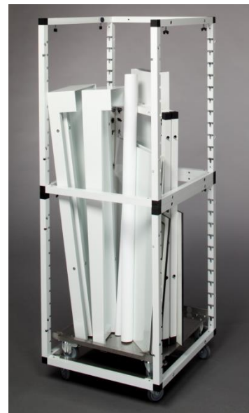
G-Raxx Bar; Breite 1,2 m