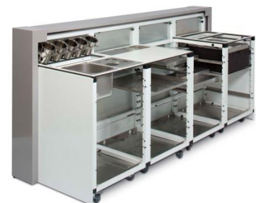
G-Raxx Bar; Breite 2,4 m